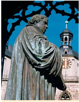
Martin Luther begegnet dem Besucher in Wittenberg an vielen Stellen.

Das dreigeteilte Programm wird sich zunächst mit den Fragen auseinandersetzen: Womit kann ich mich selbständig machen? Was machen andere innerhalb und außerhalb der internationalen Gemeinde mit Erfolg? Welche Trends kommen auf uns zu, die ich nutzen könnte? Welche Besonderheiten und Chancen ergeben sich durch mein Christsein? (G. Padderatz). Dann geht es um die Fragen: Was kommt bei einer Selbständigkeit auf mich zu – emotional, physisch etc.? Bin ich für die Selbständigkeit geeignet? Wie verändert