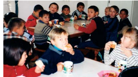
In der Ganztagschule, die von 8 bis 16 Uhr geht, gibt es eine Küche und einen Speisesaal.