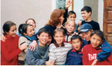
Die Atmosphäre ist gut. Schüler und Lehrer pflegen einen lockeren und fröhlichen Umgang miteinander.

Unsere Schulleiterin betreibt übrigens eine ausgezeichnete Öffentlichkeitsarbeit. So hat es bei meinem Besuch eine Begegnung mit der zuständigen Schulamtsdirektorin gegeben. Man darf nicht vergessen, dass es sich hier um ein überwiegend moslemisches Land handelt. Die Schulamtsdirektorin hat unserer adventistischen Schule große Freiheiten bezüglich ihrer christlichen Überzeugung eingeräumt. Für mich war überraschend und doch von