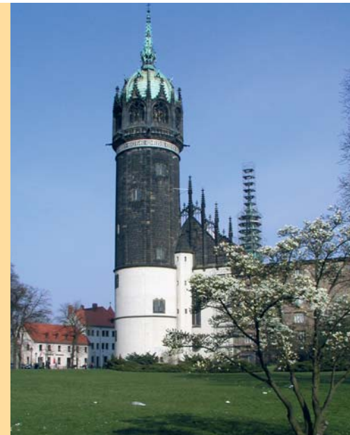
Schloßpark mit Schloßkirche, an die Luther seine 95 Thesen schlug.

einer gemeinschaftseigenen Einrichtung. Das war ursprünglich nicht so geplant, aber Platzbedarf und Logistik zwingen uns dazu. 2. Die meisten Veranstaltungen werden im Workshop-Format, d.h. mit viel Dialog, abgehalten. 3. Wir werden am Freitagabend (vor Sonnenuntergang) ein feierliches Festbankett haben. 4. Wir werden eine reformationsgeschichtliche Führung (Freitagvormittag) haben. 5. Mit unserem Workshop „Ich mache mich selbständig“ (Donnerstagnachmittag) wenden wir uns eher an potentielle als gegenwärtige ASI-Mitglieder. Wir hoffen jedoch, dass wir hier durch das gepoolte Know-how aller ASI-Mitglieder Synergien, frische Impulse, Kontakte und Querverbindungen schaffen können. 6. Jeder Teilnehmer wird ein Namensschild tragen, das ihn auch zu den Mahlzeiten berechtigt.