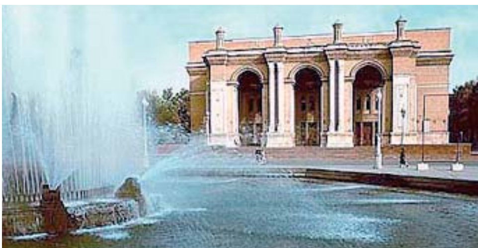
Im gesamten Regierungsbezirk Navoi mit 800.000 Menschen gab es 1994 keinen Adventisten. Heute gibt es im 144.000 Einwohner zählenden Navoi – hier das 1947 erbaute Opernhaus – mit seiner überwiegend moslemischen Bevölkerung eine lebendige Adventgemeinde.