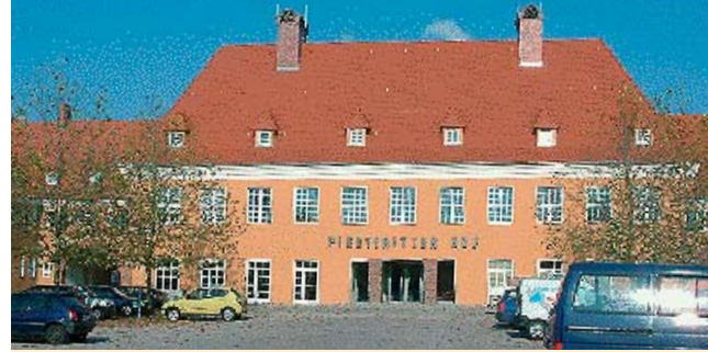
Der Piesteritzer Hof wird das Konferenzhotel der diesjährigen ASI-Tagung sein.

Wieviele werden kommen – 50, 100, 200 oder noch mehr? Das ist die Preisfrage. Aufgrund des jetzt schon verzeichneten Interesses aus dem In- und Ausland gehen wir aber eher von deutlich über 100 aus. Da es in Wittenberg kein ausreichend großes Hotel für diese Menge gibt und gleichzeitig eine andere Veranstaltung in der Stadt läuft, werden wir uns über ganz Wittenberg verstreuen. Die Logistik ist