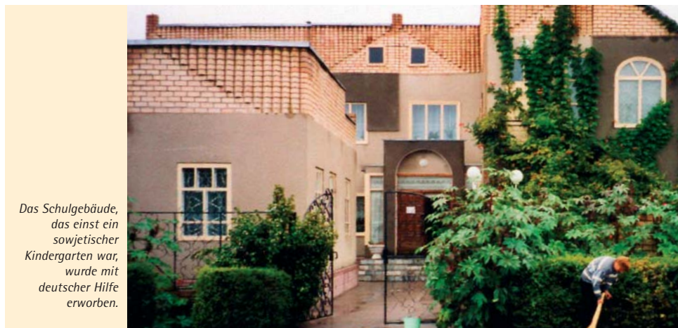
Das Schulgebäude, das einst ein sowjetischer Kindergarten war, wurde mit deutscher Hilfe erworben.