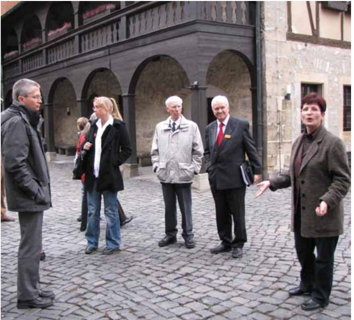
Führung durch das evangelische Augustinerkloster in Erfurt, in dem Martin Luther als Novize und junger Mönch gelebt und studiert hatte.