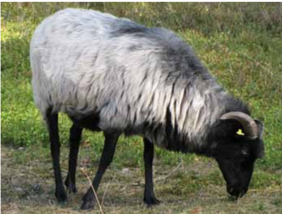
Wenn Christus die „anderen Schafe“ mit seiner Herde zusammenbringt – wird die Herde bereit sein, sie aufzunehmen?