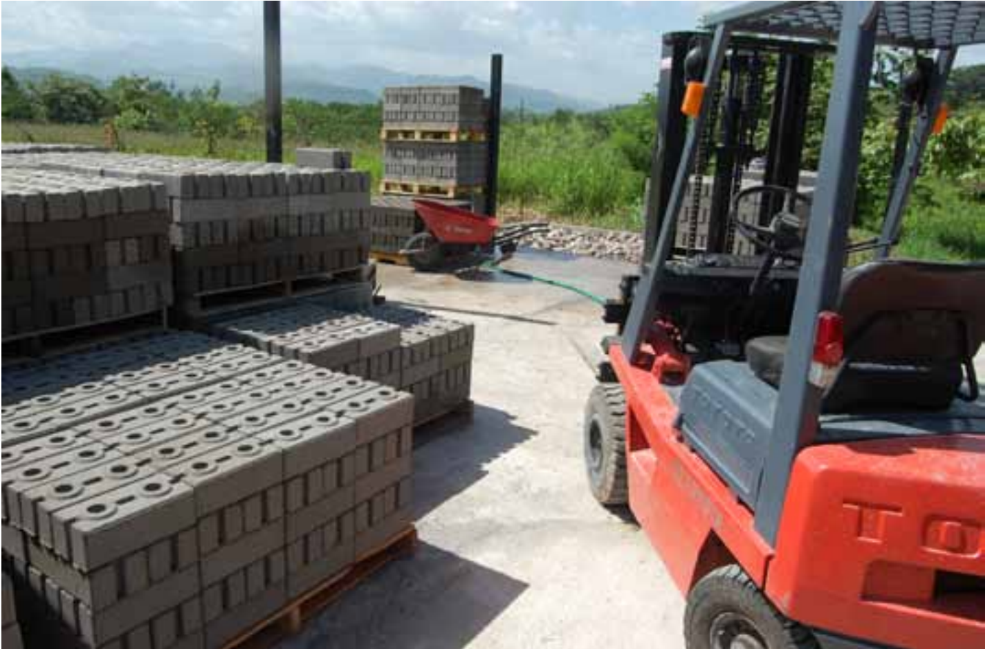
Jede Menge Ziegel für Honduras - wirtschaftliche Unabhängigkeit unterstützt die erzieherischen und missionarischen Bemühungen im Kinderheim.

erhalten, und es sollen weitere Arbeitsplätze für Menschen der Umgebung eingerichtet werden. Durch die hohe Nachfrage sind weitere Zweigstellen in Honduras, Nicaragua und Costa Rica geplant. Weiterhin möchte Viktor durch den finanziellen Gewinn die Gemeinden in ihrer Missionsarbeit unterstützen.